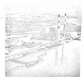
Illustration de la volonté des communistes de lutter pour l'utilisation de toutes nos ressources énergétiques ; le combat victorieux mené pour la construction des tranches 4 et 5 de Cordemais.

« Il est bien entendu que dans notre esprit ces grands dossiers que nous venons d'évoquer ne mettent pas de côté