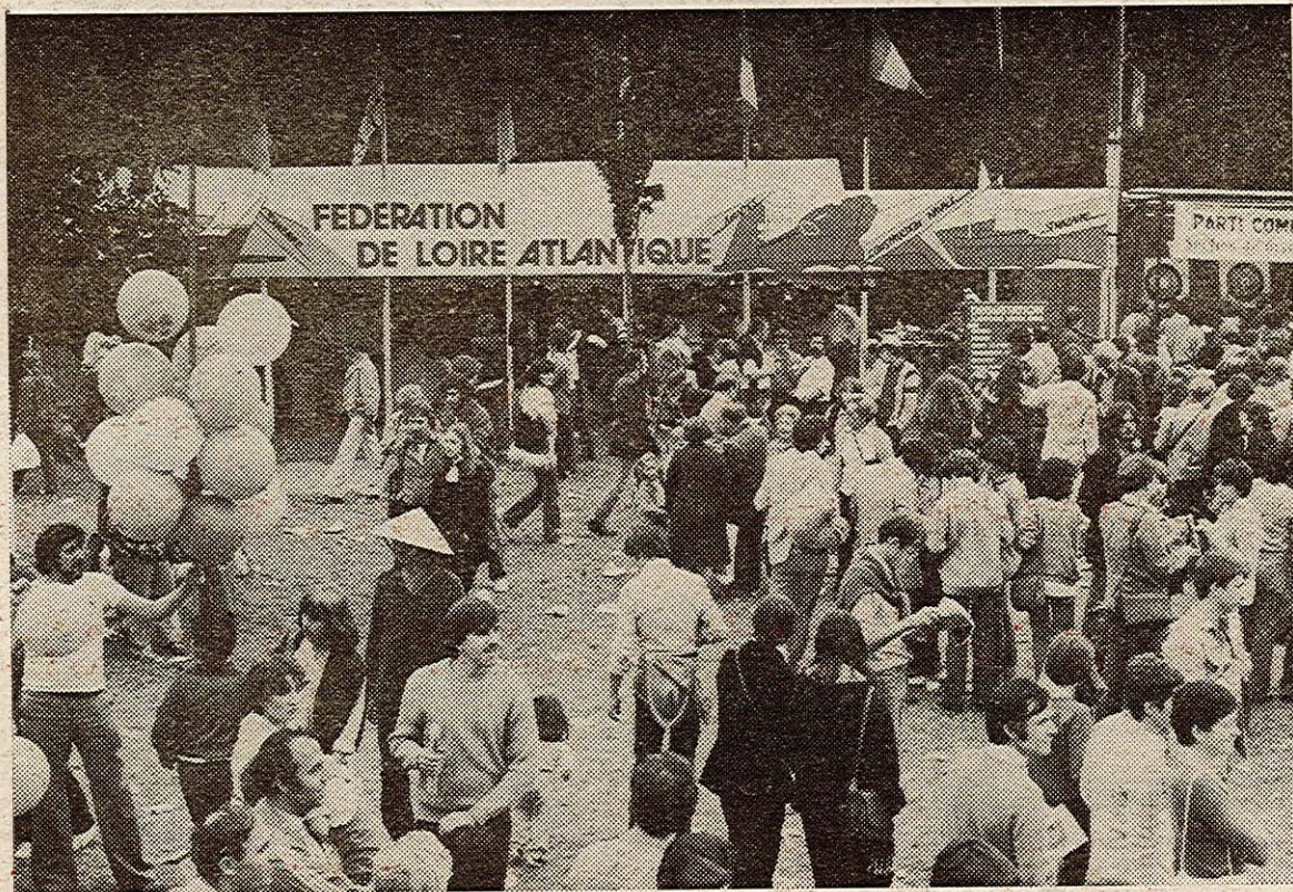
Eclatant succès de la fête de l'Humanité 1980, année record pour le nombre de participants, le chiffre des vignettes, des adhésions au parti, des abonnements à « L'Humanité », à « Révolution », des livres « L'Espoir au présent » vendus durant ces deux jours. Que tous ceux qui ont contribué à ce succès en soient ici remerciés.

Hebdomadaire départemental du Parti Communiste Français - N° 141 - 18 Septembre 1980 - Prix : 1 Franc