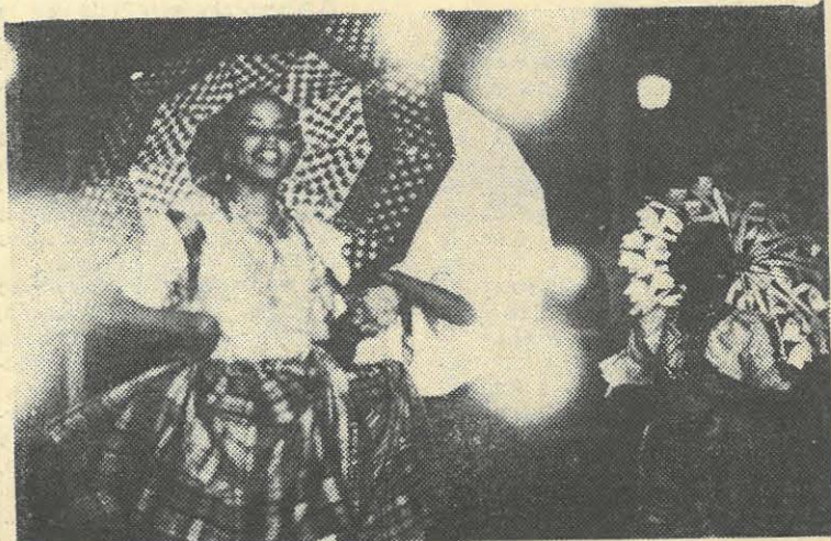
Le ballet de La Martinique qui sera présent à la fête cette année

Les élus communistes souhaitent que l'esprit de responsabilité engagé le maire de Nantes à revoir sa position, dans l'intérêt des peuples et de la coexistence pacifique, très menacés en cette période de notre histoire.