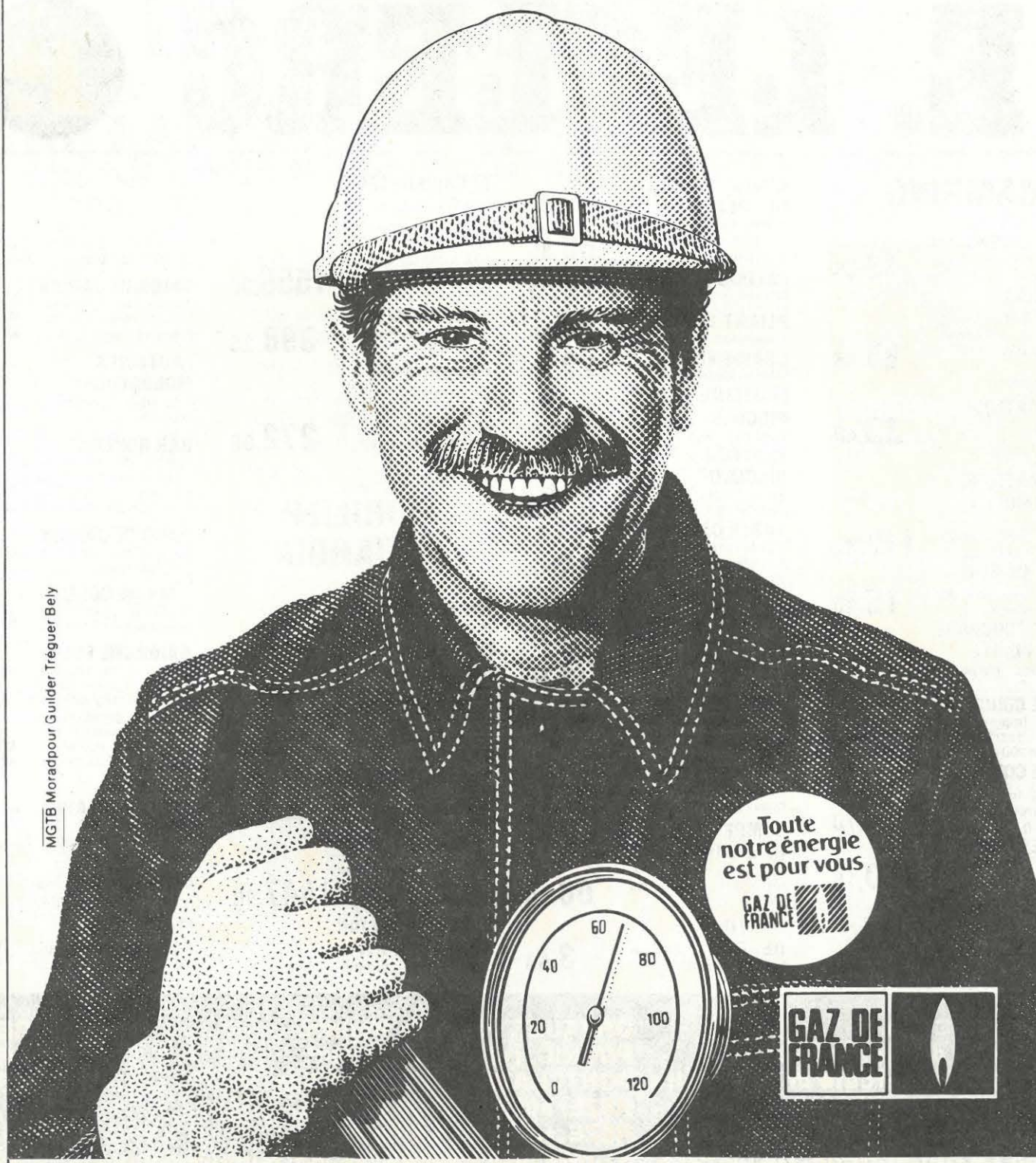
MGTB Moradpour Guilder Tréguer Bely