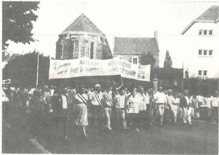
Les élus communistes manifestent.

Le dirigeant syndical démontrait qu'aucune fatalité n'existait, que le choix du déclin c'est celui de la Direction d'Alstom. Pour la C.G.T., le développement de la construction navale passe par des prises de commandes sur le plan international, national pour rénover et moderniser la flotte française. Il n'y a pas de troisième voie.