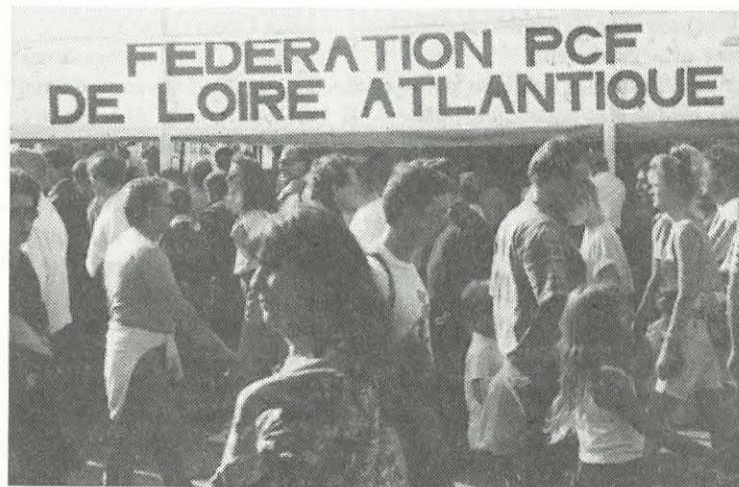
Devant le stand de Loire-Atlantique

Le stand a connu une grande affluence et les produits régionaux présentés ont connu un succès sans précédent.