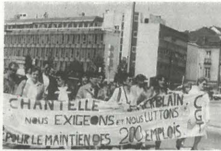
En marche vers le siège du Conseil Général.

L'Assemblée Départementale exige donc que toutes dispositions légales et réglementaires soient prises, tant au niveau national qu'europpéen, notamment dans les domaines douanier et social, pour permettre la préservation durable des emplois industriels et tertiaires et demande que dans l'intervalle le Gouvernement exprime clairement son refus de la délocalisation de CHANTELLE en prenant toutes les mesures concrètes en son pouvoir.