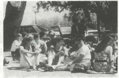
Souriantes et déterminées.