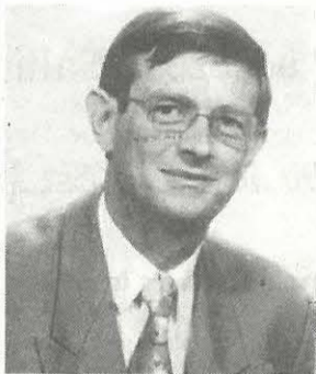
par Jean-René Teillant Secrétaire Fédéral