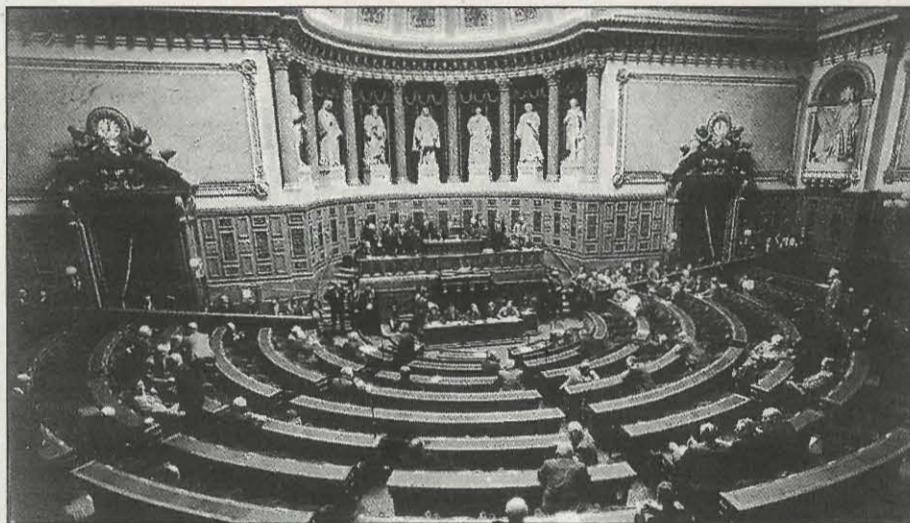
Le groupe Communiste, Républicain et Citoyen au Sénat

Malgré l'introduction de la parité et un élargissement de la proportionnelle, le Sénat a besoin d'un grand dépoussiérage.