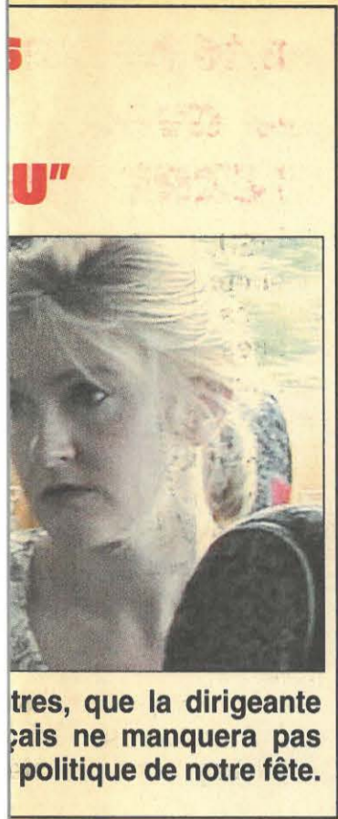
tres, que la dirigeante çais ne manquera pas politique de notre fête.